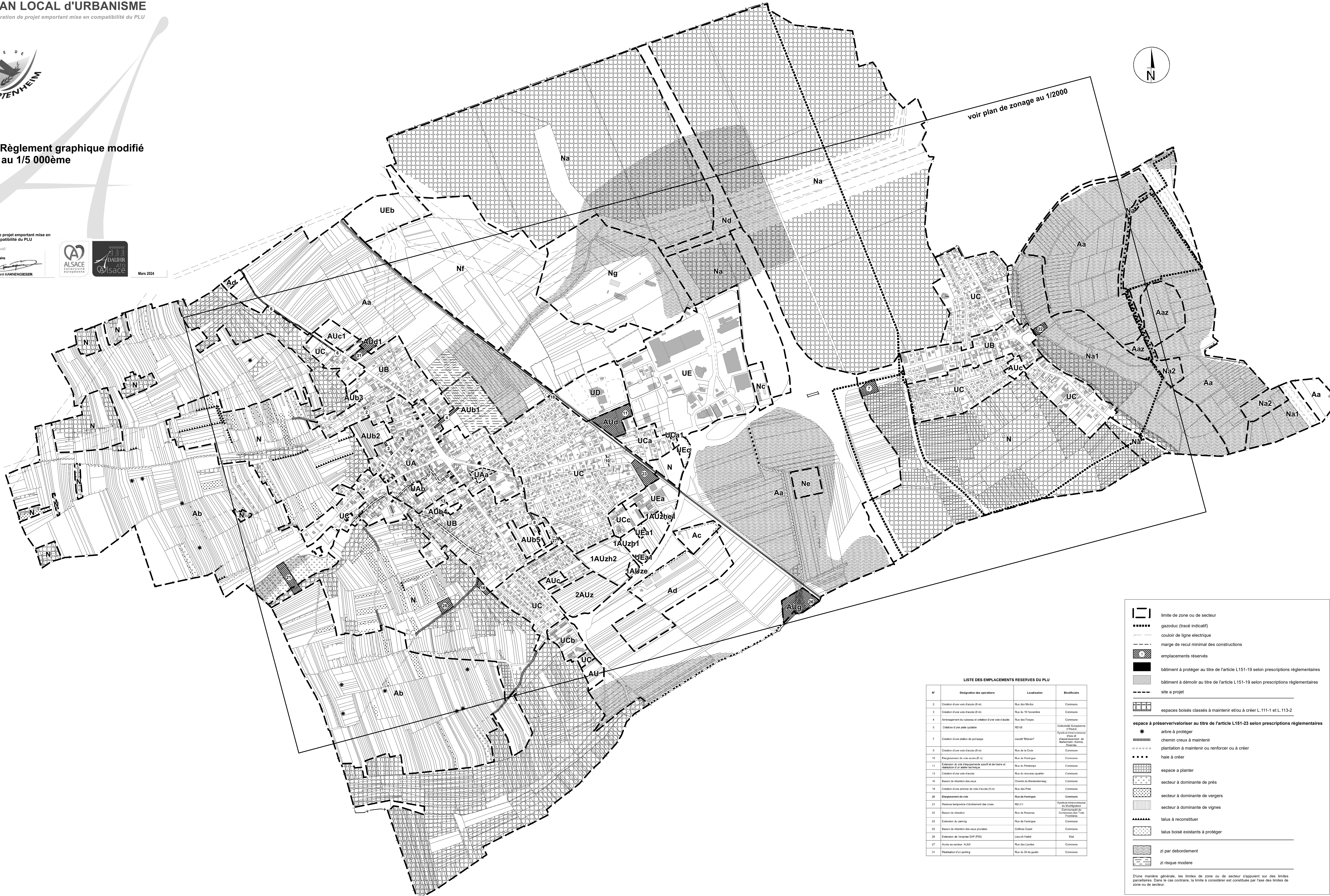
LISTE DES EMPLACEMENTS RESERVES DU PLU